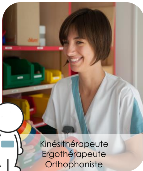
Kinésithérapeute Ergothérapeute Orthophoniste