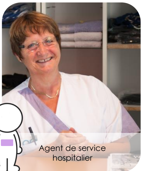
Agent de service hospitalier