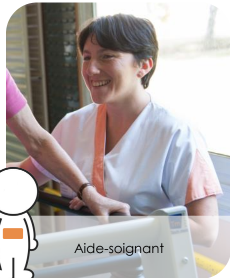
Tenue blanche et abricot